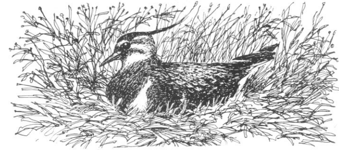
Viben yngler helst på steder med lave planter, f.eks. en afgræsset eng.

Bjerge, mens andre arealer afgræsses af forskellige typer kvæg i privat eje. Naturens udvikling følges nøje, ikke mindst i sårbare områder med f.eks. orkideer. Her er det særlig vigtigt, at plejen udføres, så de sjældne planter bevares.