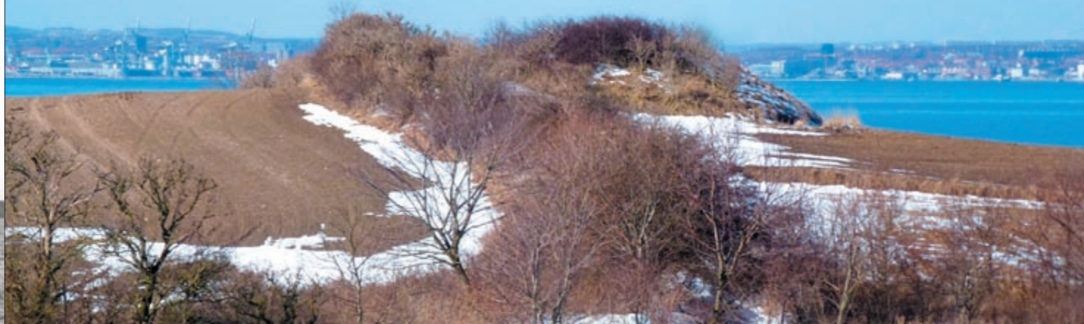
Gravhøjen Bræmhøj, det fredede herregårdsdige og i baggrunden Århus Havn