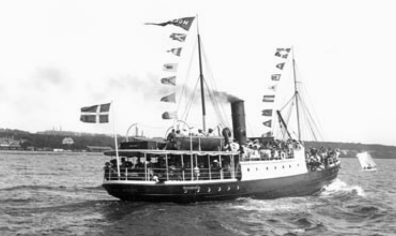
Paketskibet »Mols« på vej mod Skødshoved en sommerdag i 1904