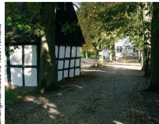
Bindingsværkslade fra 1599 i Nimtofte

Syd for A16 forløber Gjerrildbanestien igen på det gamle baneforløb indtil Nimtofte by. Nimtofte er en fin gammel kirkelandsby, hvis fredede præste-gård kan fremvise en smuk bindingsværkslade fra 1599.