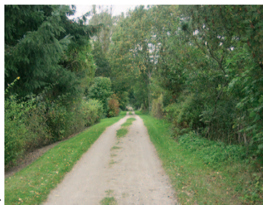
Gjerrildbanestien nord for Stokkebro

Den lille landsby Tranehuse, hvor banen gik igennem, fik også eget »stationskvarter«, omend noget mindre end Stokkebros.