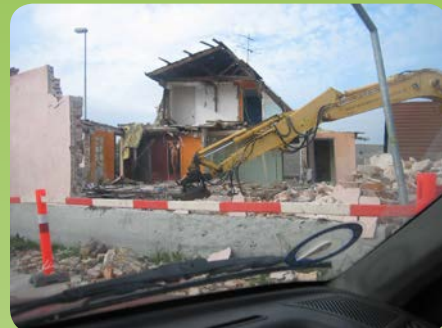
Det gamle cafeteria og diskoteque rives ned

gennem Kulkanalen havde forbindelse til kanalerne i Sundet. Her i stationsområdet har de første ”Kolinesere” (stenalderfolkene) boet. Her har man fundet store køkkenmøddinger.