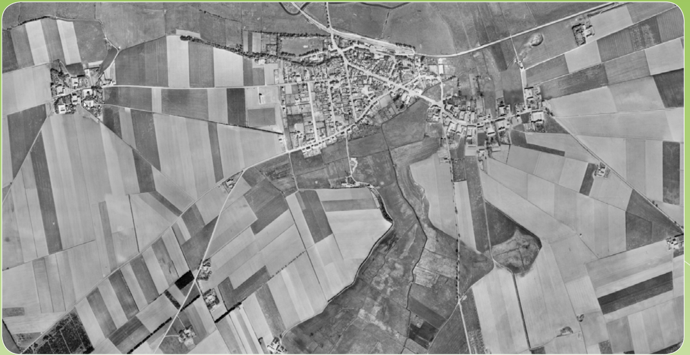
Luftfoto af Kolind. Det øverste er fra 1954 og det nederste er fra 2013