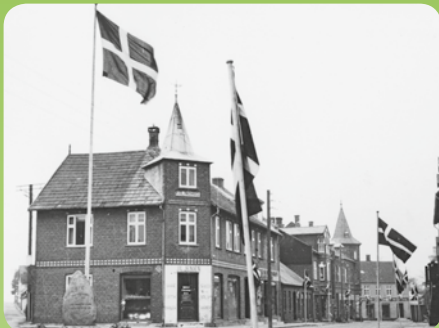
Torvet i Kolind omkring 1935