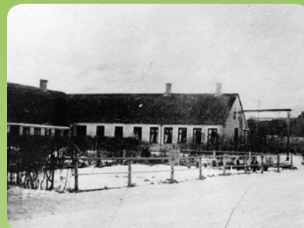
Kolinds gamle skole på Nødagervej

Senere ændres vandretningen, så vandet løb mod Grenå. Her udgravedes også en dal, som havde forbindelse til havet. Da isen var bortsmeltet lå, der derfor en fjord tilbage. Den har fået navnet "Kolindsund".