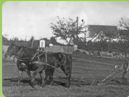
Den gamle Kolind Kirke fra før 1918