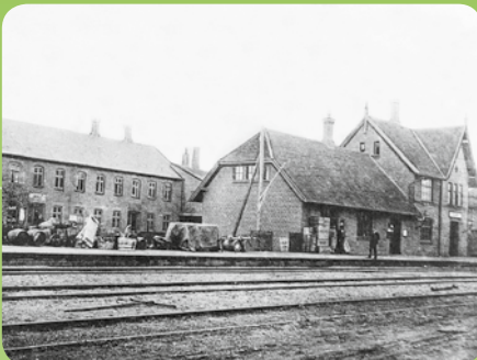
Kolind Station ca. 1920