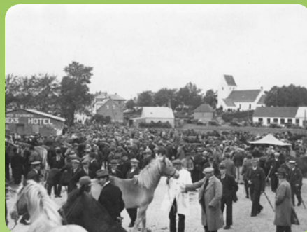
Markedspladsen ved Byhallen