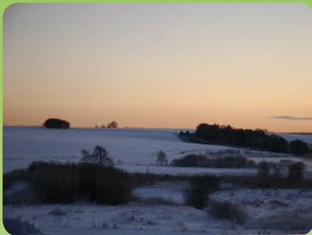
Udsigt over Kolind enge