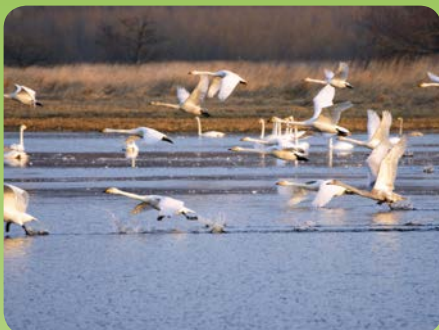
Sangsvaner i Kolind Engso