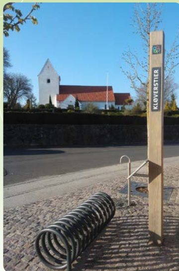
Det er her de 4 ruter starter.

Husk at passe på naturen, efterlad ikke affald, hunde skal altid holdes i snor og efterladenskaber skal opsamles!!